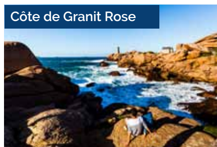
Côte de Granit Rose

Cet itinéraire a la particularité de relier La Vélomaritime®, itinéraire côtier reliant Roscoff à Dunkerque en longeant la Manche, et La Vélodyssée®, reliant Roscoff à Hendaye, le long de l'Atlantique.