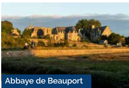
Abbaye de Beauport