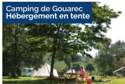
Camping de Gouarec Hébergement en tente

De 30€ à 60€ la nuit, plus d'infos sur www.campingdegouarec.com