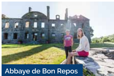
Abbaye de Bon Repos