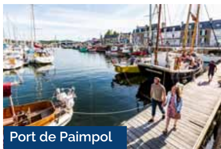
Port de Paimpol

L'aventure à vélo débutera au Moulin à marée de Poulafret, construit au XIX e siècle et se poursuivra avec une halte à l'Abbaye de Beauport, qui date de 1202, face à la mer. On y découvrira l'élégante architecture gothique et ses jardins. En poursuivant votre balade, toujours en bord de mer, vous croiserez sans doute l'emblématique mouette mélanocéphale. Le circuit se termine à la pointe de Guilben, longue langue de terre et de roches s'élançant vers le large où vous pourrez apercevoir, à marée basse, les immenses étendues de sable allant jusqu'à la Pointe de Plouézec.