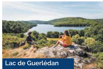
Lac de Guerlédan

Pour passer la nuit, de nombreux hébergements labellisés «Accueil Vélo» sont accessibles à proximité de l'itinéraire, parfaits pour reprendre des forces une fois le soir venu. Vous pourrez, par exemple, séjourner au camping de Gouarec, au bord du canal, qui propose des logements originaux tels que caravanes classique des années 60, des gîtes, mais aussi la cabane du berger qui a tout pour plaire, située dans la partie la plus boisée du camping.