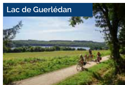
Lac de Guerlédan