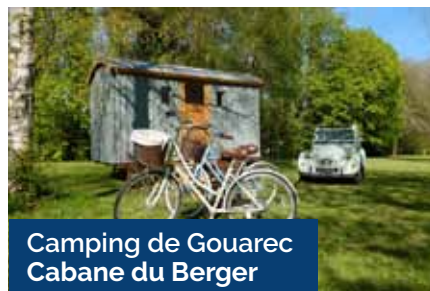
Camping de Gouarec Cabane du Berger