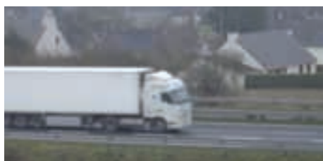
Flux de marchandises en Côtes d'Armor (2007) - Millions de tonnes